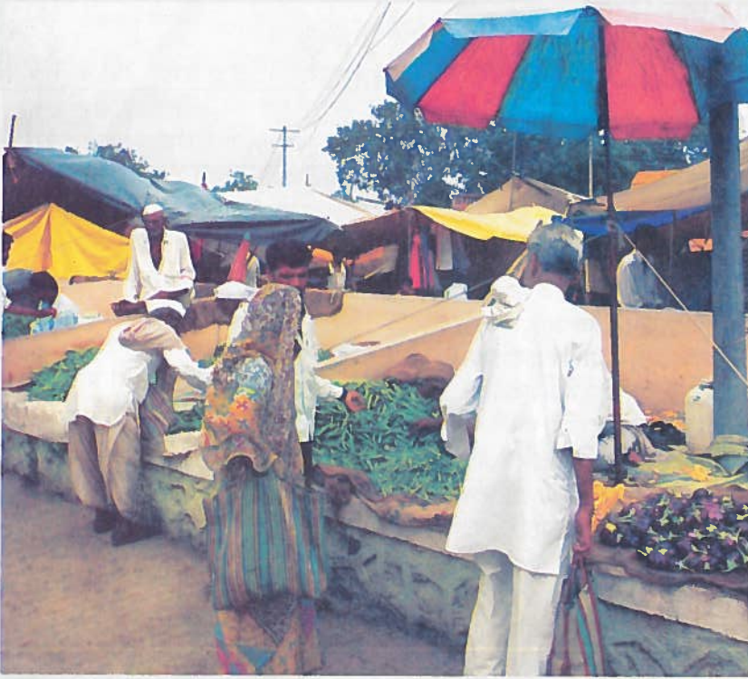
बाजार ओटे झाल्याने असा टापटीपपणा आला

चढउतार किती आहेत, त्यात किती महिने पाणी असते, त्याचा परिसरातील विहिरींवर काय परिणाम होतो, वनसंपदा किती हे जे ओळखतात ते त्याच्या नियोजनामागे लागतात. या दूरदृष्टिसाठी व प्रशिक्षणासाठी शासकीय पातळीवर विविध संस्था कार्यरत असतात. शासनाच्या विविध योजना ग्रामविकासासाठी आहेत. यात महात्मा ज्योतिबा फुले जल व भूमिसंधारण अभियान, नरेगा, स्वर्णजयंती ग्राम स्वरोजगार योजना,