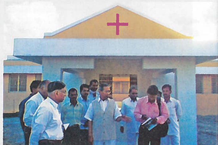
गावात उभे राहलेले आरोग्य केंद्र