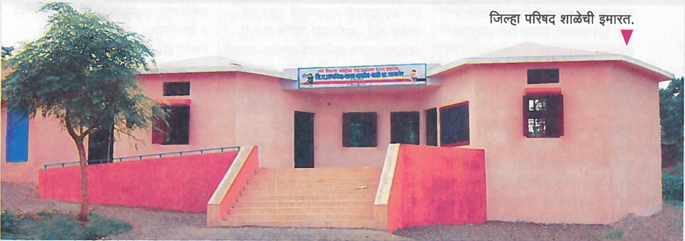
जिल्हा परिषद शाळेची इमारत.

लोक म्हणतात व्यावसायिक जीवनात स्थिरस्थावर झाल्यानंतर तसे पाहता भाऊंना पुन्हा गावाकडे परतण्याची गरज नव्हती. परंतु, जन्मगावाप्रती कृतज्ञता होती, त्या कृतज्ञतेने स्वस्थ बसू दिले नाही. ज्या गावात आपण वाढलो, घडलो त्या गावासाठी काही करणे ही आपली जबाबदारी आहे. या नैतिक भूमिकेतून वाकोद ग्रामविकास प्रकल्पाची रूपरेषा आखली. बदलत्या राजकीय संदर्भानुसार आज खेड्यापाड्यात निर्माण झालेल्या गटबाजीसारख्या प्रकारात वाकोद