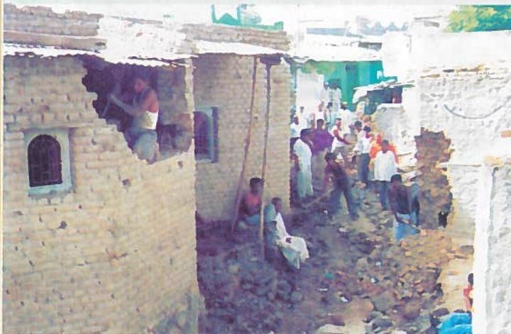
पूर्वी अरुंद असलेला रस्ता.

गावातील प्रतिनिधी निःस्वार्थी, निर्भीड आणि पारदर्शी काम करणार असतील तर ख-या अर्थाने विकासाचे पर्व गावागावात सुरु होईल. शासकीय योजना या सर्वांसाठी असतात. कारण शासन हे सगळ्यांचे प्रतिनिधित्व करीत असते. गावातील पक्षीय राजकारणाला निवडणुकांपुरते महत्त्व असले पाहिजे. निवडणुका झाल्यानंतर विनाकारण घराघरामध्ये, गल्ली-गल्लीमध्ये पक्षीय राजकारणाच्या फायद्यासाठी संगत निर्माण करणे ग्रामविकासाचे, सत्तेच्या विकेंद्रीकरणाचे ध्येय असता कामा नये. निवड झाल्यानंतर गावाचे प्रतिनिधित्व आपण करीत असल्याचे भान तिथल्या प्रतिनिधींना असले पाहिजे. निव्वळ आपल्या पक्षापुरता दृष्टिकोन ठेवला तर गावातील विकास प्रक्रियेत सातत्याने अडथळे निर्माण होतात. पक्षातीत कारभार करावयाचा ठरल्यास विकासाचा वेग किमान दुप्पट होऊ शकतो. निःस्वार्थपणे, उच्च दर्जाचे काम करावयाचे ठरल्यास हाच वेग आणखी दुप्पटीने वाढू शकतो. अर्थातच या सर्व कारभारात